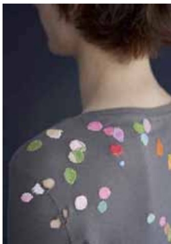
Bild från teknikhäftet "Stoppa" från Hemslöjdens förlag.

Kunniga medlemmar från Stockholms läns hemslöjdsförening och Hemslöjdens förlag ger råd och tips och visar fina inspirationsplagag.